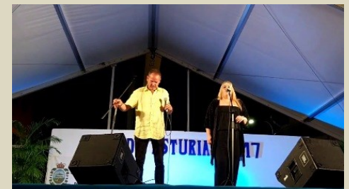
En la actuación del pasado año