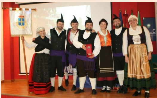
Banda de Gaitas del Centro Asturiano de Málaga "Brisas de Asturias"